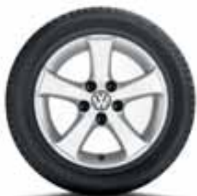
CERCHIO IN LEGA SIMA ORIGINALE VOLKSWAGEN

Disponibile anche come ruota completa invernale.