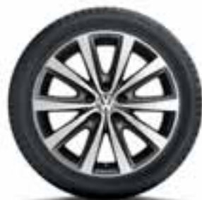
CERCHIO IN LEGA SYENIT ORIGINALE VOLKSWAGEN