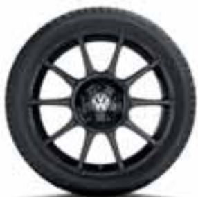
CERCHIO IN LEGA MOTORSPORT ORIGINALE VOLKSWAGEN