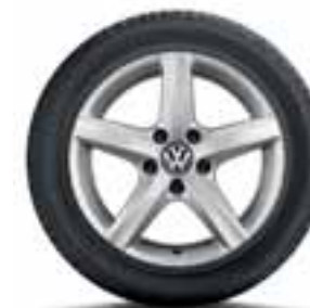
CERCHIO IN LEGA ASPEN ORIGINALE VOLKSWAGEN