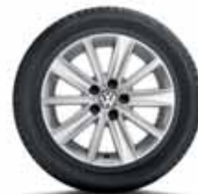
CERCHIO IN LEGA ZIRKONIA ORIGINALE VOLKSWAGEN