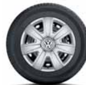
COPRICERCHIO ORIGINALE VOLKSWAGEN