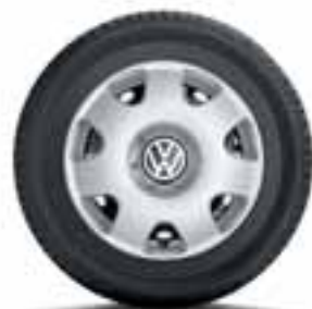
COPRICERCHIO ORIGINALE VOLKSWAGEN