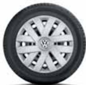
COPRICERCHIO ORIGINALE VOLKSWAGEN