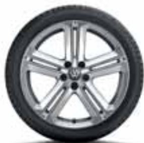
CERCHIO IN LEGA MALLORY ORIGINALE VOLKSWAGEN